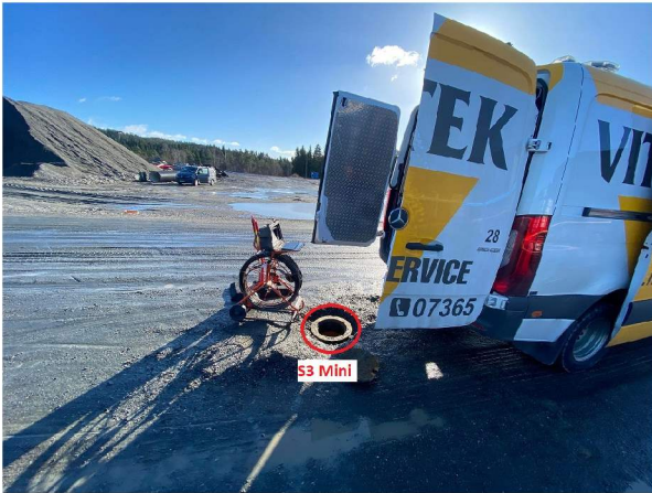
L2252022 105924 AM_S3 Mini_S2 Mini_250222_142232_43.jpg, 00:00:00, 0.00m Start inspeksjon, 0% / S3 Mini