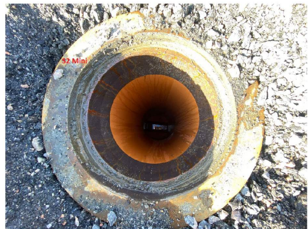
L2252022 105924 AM_S3 Mini_S2 Mini_250222_142232_50.jpg, 00:05:00, 30.30m Inspeksjon fullført / S2 Mini