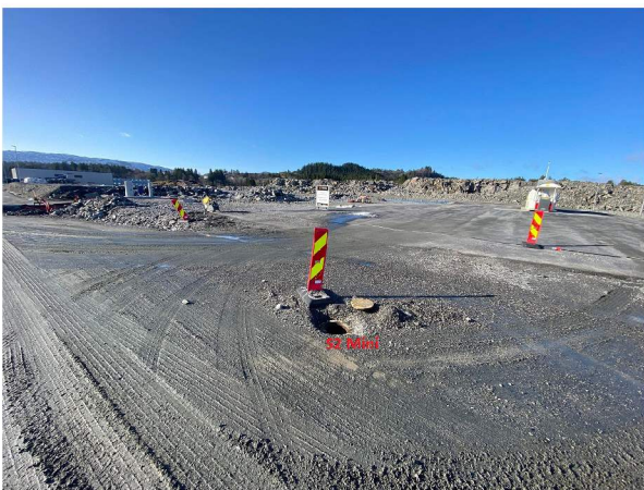
L2252022 105924 AM_S3 Mini_S2 Mini_250222_142232_49.jpg, 00:05:00, 30.30m Inspeksjon fullført / S2 Mini