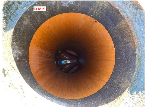
L2252022 105924 AM_S3 Mini_S2 Mini_250222_142232_44.jpg, 00:00:00, 0.00m Start inspeksjon, 0% / S3 Mini