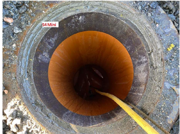
L2252022 110048 AM_S32 Mini_S4 Mini_250222_130628_22.jpg, 00:00:00, 0.00m Start inspeksjon, 0% / S4 Mini