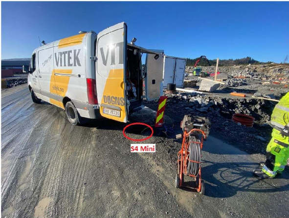
L2252022 110048 AM_S32 Mini_S4 Mini_250222_130628_21.jpg, 00:00:00, 0.00m Start inspeksjon, 0% / S4 Mini