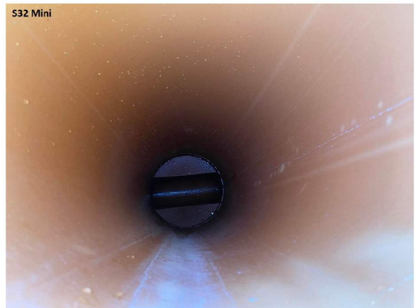
L2252022 110048 AM_S32 Mini_S4 Mini_250222_130628_24.jpg, 00:01:04, 5.52m Inspeksjon fullført / S32 Mini