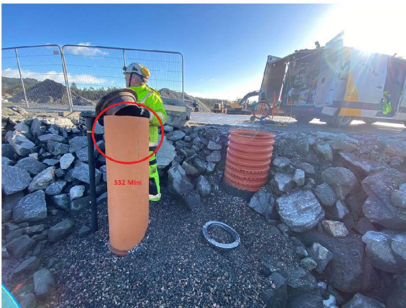
L2252022 110048 AM_S32 Mini_S4 Mini_250222_130628_23.jpg, 00:01:04, 5.52m Inspeksjon fullført / S32 Mini