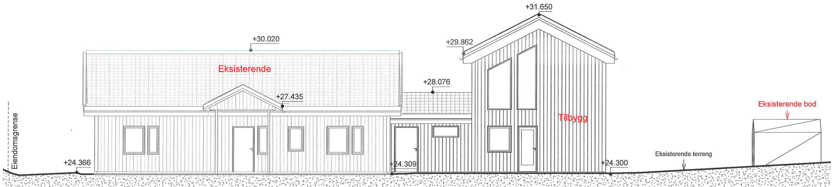
Sør 1 : 100