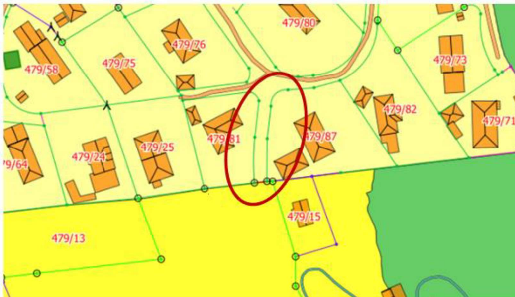
Utsnitt frå planregisteret

Det må vurderast å leggje tilkomstvegen inn til planområdet via fylkesveg 565 Radøyvegen og eksisterande privat veg på 479/2. Denne tilkomsten er regulert i rp Austmarka Øvre, men føresegnene indikerer at denne er tenkt sanert ved vidare utbygging i øvre del av Austmarka. Ein stor mangel ved denne planen, er at det ikkje er regulert ny tilkomst/kjøremønster for dei som nyttar avkøyringa i dag.