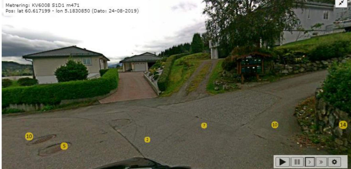
Vegfoto med nemte korridor i senter av bilete