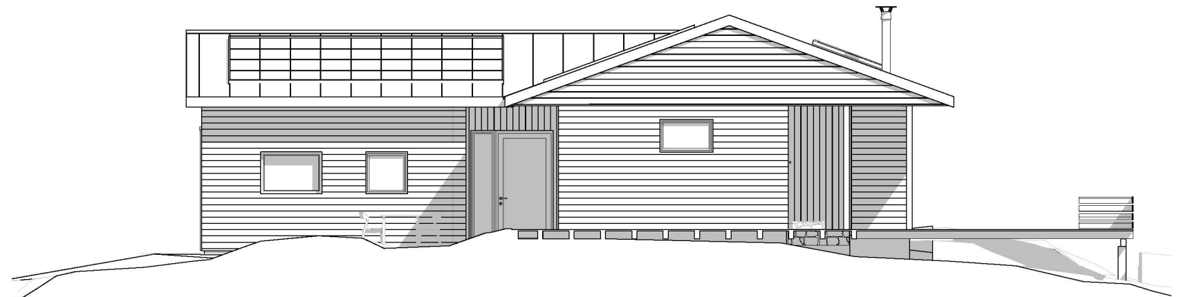
Fasade sør-øst 01 - Planlagt