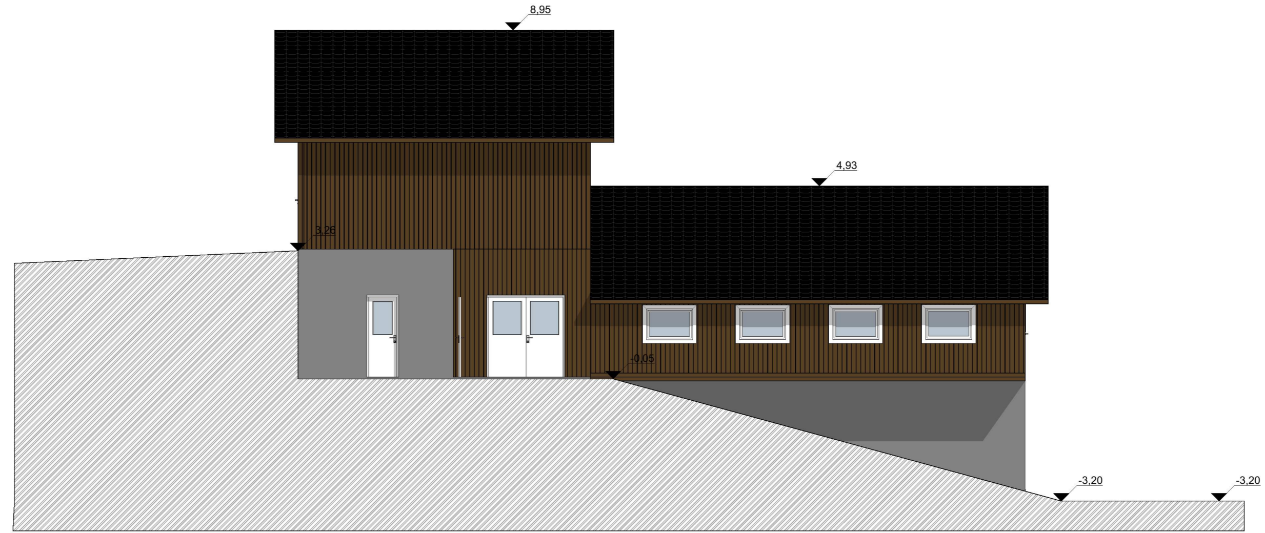
1:100 Fasade Nordvest