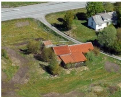
Tunet på gnr 137, bnr 690

Samla sett er området ved lemstova og løa eit viktig kulturmiljø ved Alver. Kulturmiljøet består av løe, lemstove, automatisk freda kulturminne og landbruksareal. På Alver gnr.137, bnr. 690 ligg det i dag eit kulturmiljø der heile eigendommen har høg regional verdi og nasjonal interesse. Som del av kulturmiljøet ligg landbruksarealet og ein automatisk freda lokalitet frå senneolitikum/eldre bronsealder. Den automatisk freda lokaliteten viser at området har jordbruksspor heilt tilbake til neolitikum (yngre steinalder). Som eit område med svært stor tidsdjupne er samanhengen mellom bygningane på garden, jordbrukslandskapet i seg sjølv og bruken av dette, viktig for opplevinga og forståelsen av kulturmiljøet som heilhet. Den sentrale plasseringa av kulturmiljøet, gjev unike kvalitetar i forhold til formidling av området si historie, noko som det må takast omsyn til i den vidare planlegginga. Kjelde: Fylkeskonservator