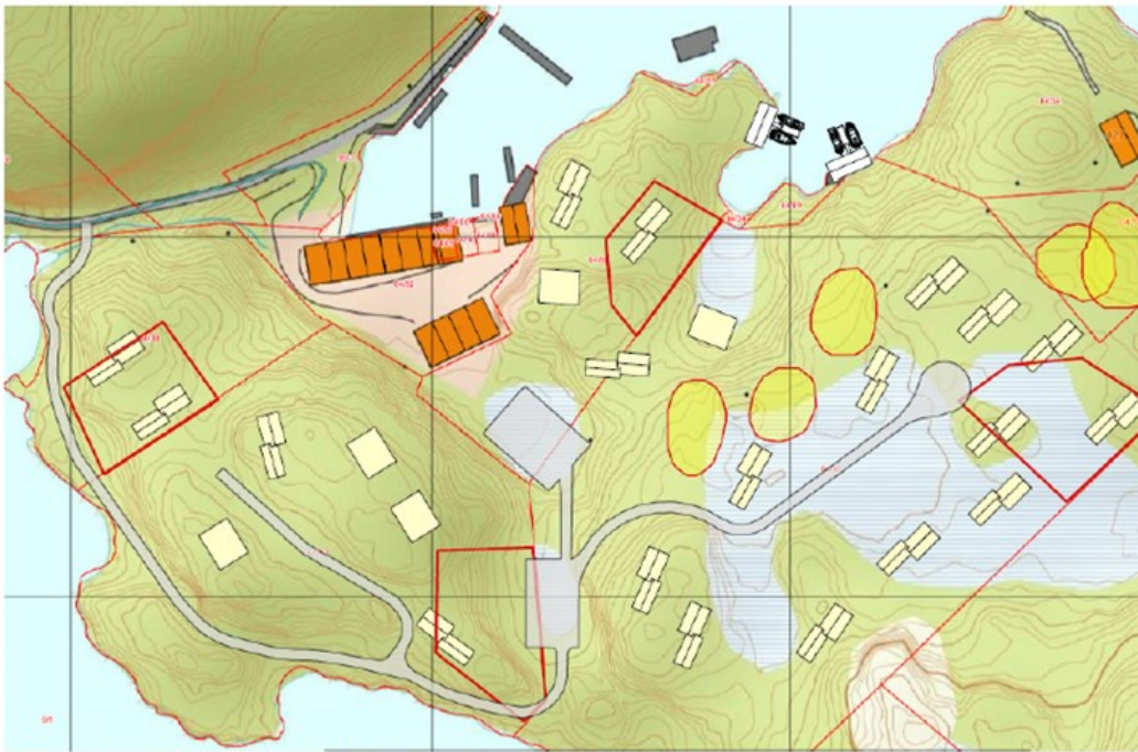
Tilkomst til hyttefeltet er foreslått lagt langs med Kjesettjørna, i vest

For å unngå konflikt med eksisterande naustområde vert det no foreslått ny avkjørsel ved Kjesettjørna, sjå illustrasjon under.