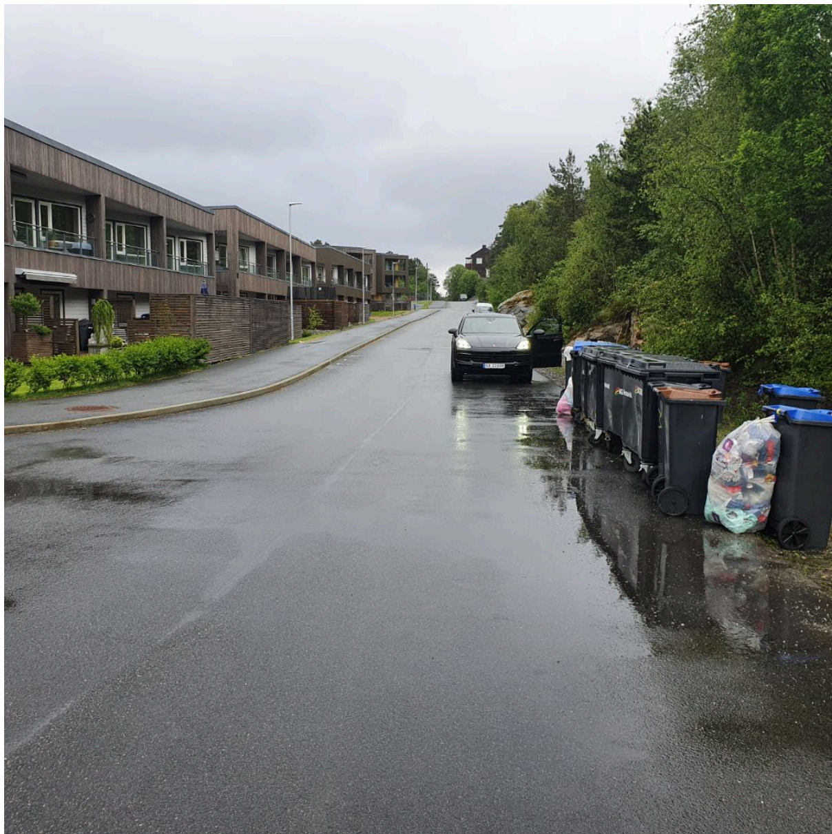
Bilde tatt ved hus 6 i felt B24 – i kryss. Viser veg 2 lags hele B24, ferdigstilt vei, fortau og lys.