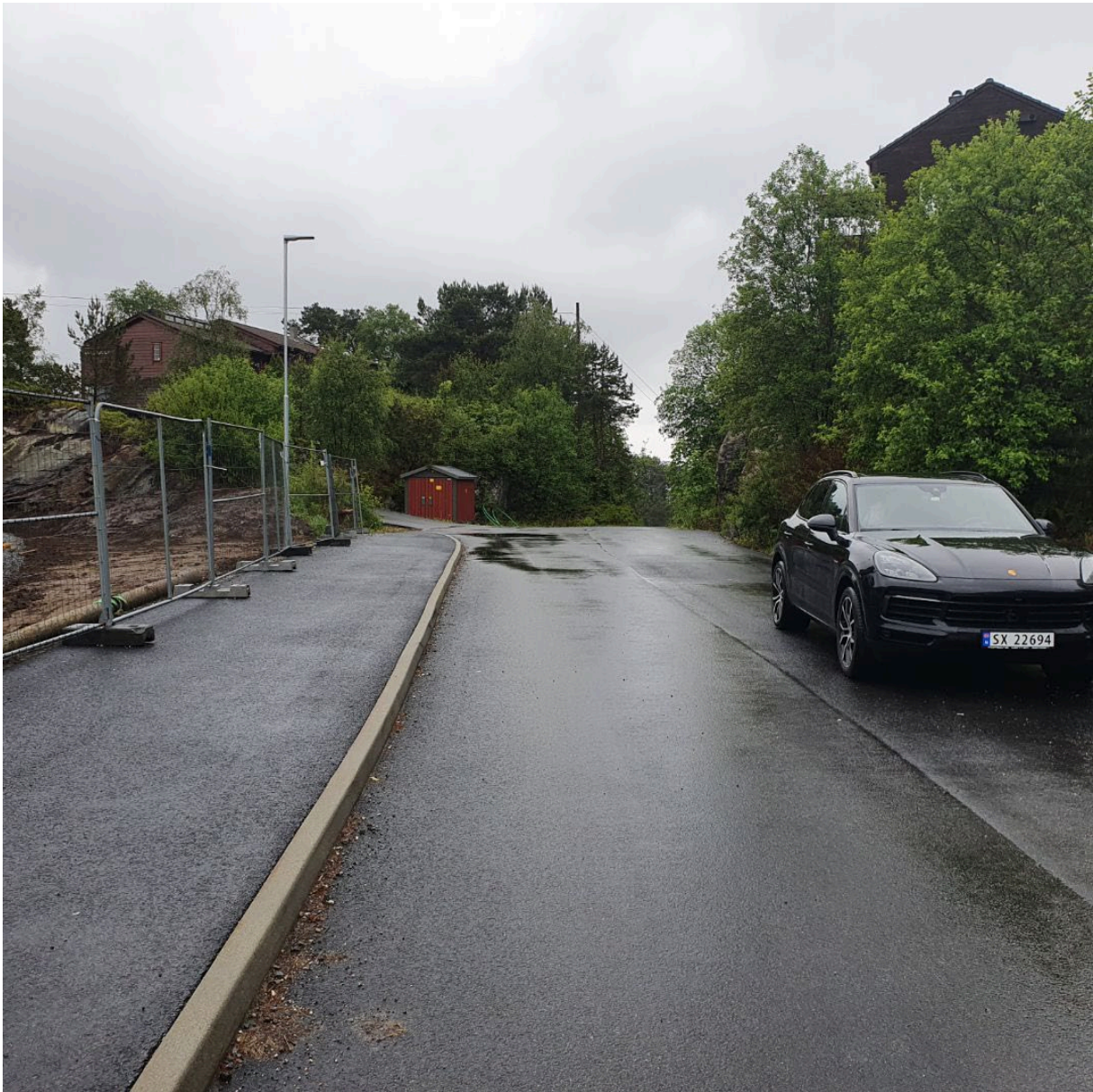
Bilde tatt ved hus 2 i felt B24 – mot ende av veg 2.