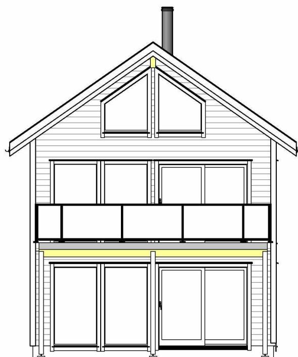
Fasade mot Vest