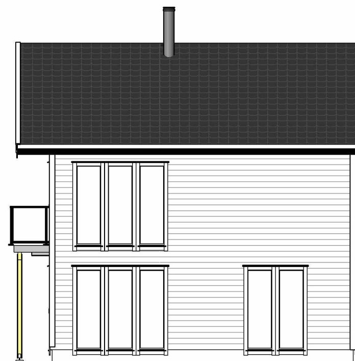
Fasade mot Sør