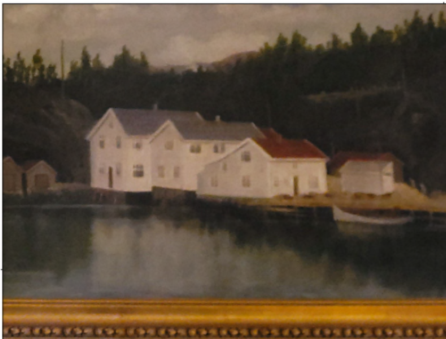
Tidlegare fasaderekke. Teke frå maleri som heng på veggen i bokkafeen i nabobygget. Utklipp frå søknad.