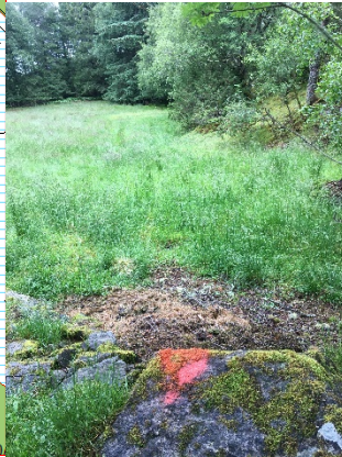
Bilete mot nord 23.06.2022