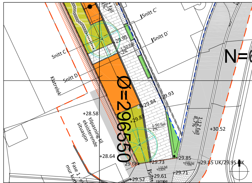
Plan - Snitt CC' 1:500