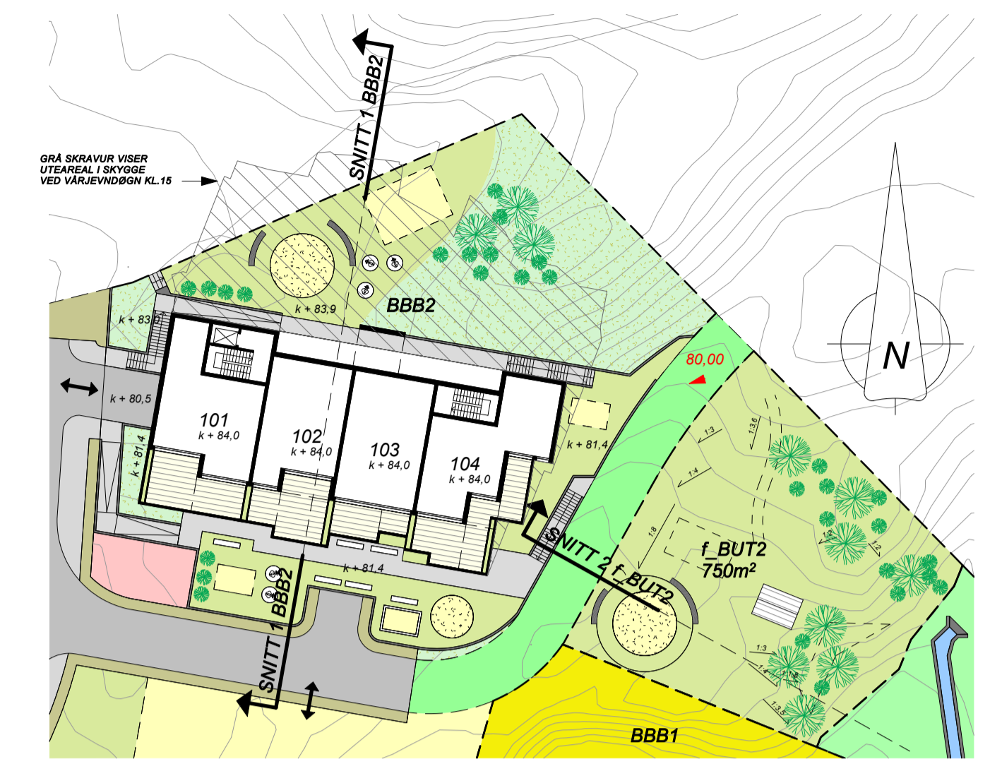
5 Detaljutsnitt BBB2 1-500 1 : 500