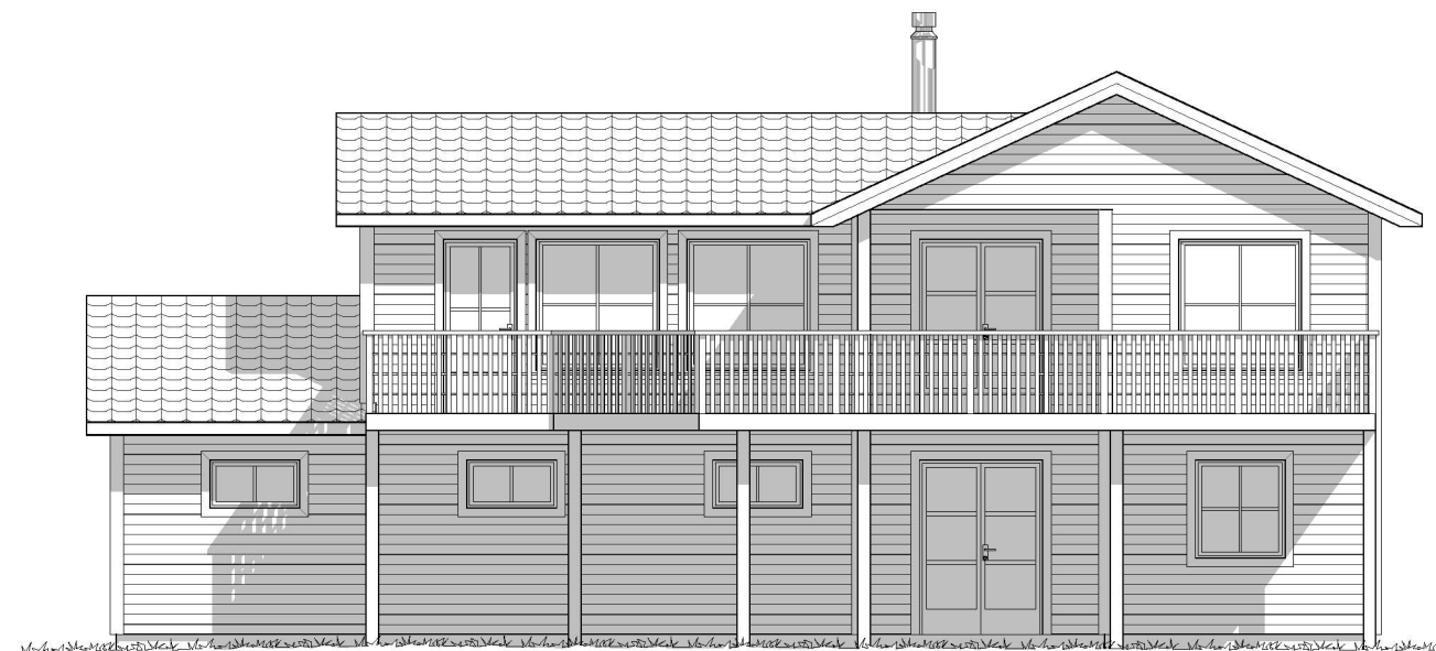
FASADE MOT SØR/VEST