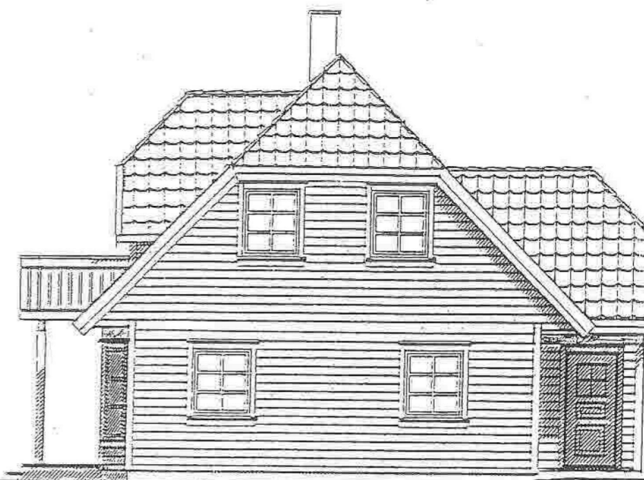
FASADE MOT: NORD