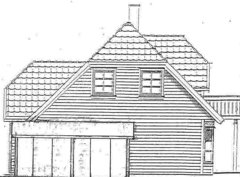
FASADE MOT: SØR