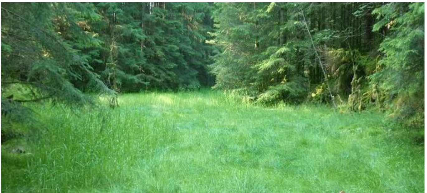
TORVMYRA: Dette er deler av den gamle torvmyra i Veneset. Torvmyrene fungerer som eit effektivt lager av karbondioksyd og eit viktig vern for bevaring av klima og biologisk mangfald. Torvtaking har slik sett ikkje berre ein kulturhistorisk, men også ein nærings- og energihistorisk, verdi.

I fleire år har jorda lege brakk, men no har gardsbruket så smått byrja å ta i bruk att utmarka.