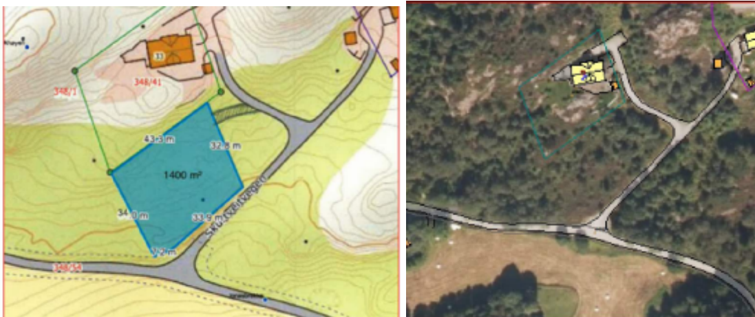
Figur 1 Frå situasjonskart og flybilde same stad

Det vert søkt om oppretting av tomt på 1400 m 2 . Aktuelt areal er klassifisert som skog i NIBIO sitt gardskart. Treslaget er lauvskog/blandingskog.