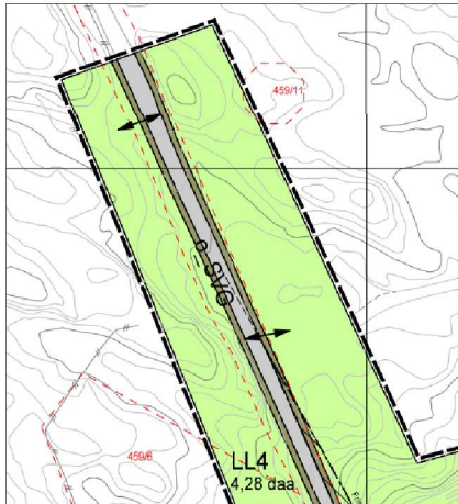
Utsnitt frå plankartet

utforminga. Det er uklårt for oss kva som vert dimensjonerande køyretøy for avkøyrsla og ber om meir informasjon om dette.