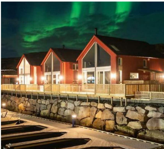
Over: Rorbuer i Lofoten, Balstad

Det er etter vårt syn ingen tvil om at det ikkje er denne definisjonen som er lagt til grunn i den reviderte planen. Her har ein bevisst flytta dei inn på land og heva dei frå opp frå sjøve kaifronten. Med bakgrunn i dette legg me til grunn at det her er «moderne rorbuer» som primært vert nytta som fritidsbustad som er planlagt – det gjer igjen sitt til at korkje terrasse eller relativt store glassareal kan sjåast som framandelement. Bilda under er hente etter eit enkelt søk på «moderne rorbuer» og underbygger etter vårt syn at både definisjonen og arkitekturen på rorbuer dei siste åra er kraftig endra og modernisert - på same måte som også anna arkitektur naturleg endrar seg over tid.