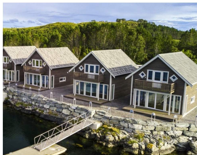
Over: Rorbuer, Nærøysund, Rørvik.