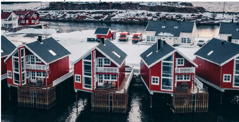
Under: Rorbuer på Svinøya under