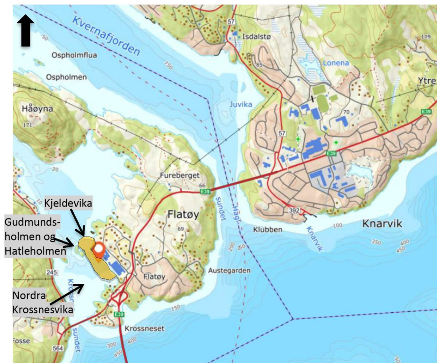
Figur 2-1: Oversiktskart – Planlagt utfyllingsområde er omtrentlig markert med oransje skravering.

Det ble i undersøkelsen i 2013 påvist noe forurensning i sedimentene i Kjeldevika, nord i planlagt utfyllingsområde. På bakgrunn av dette, og at øvrig utfyllingsområde ligger like utenfor et industriområde, kan det ikke utelukkes at sedimentene i hele utfyllingsområdet er forurenset.