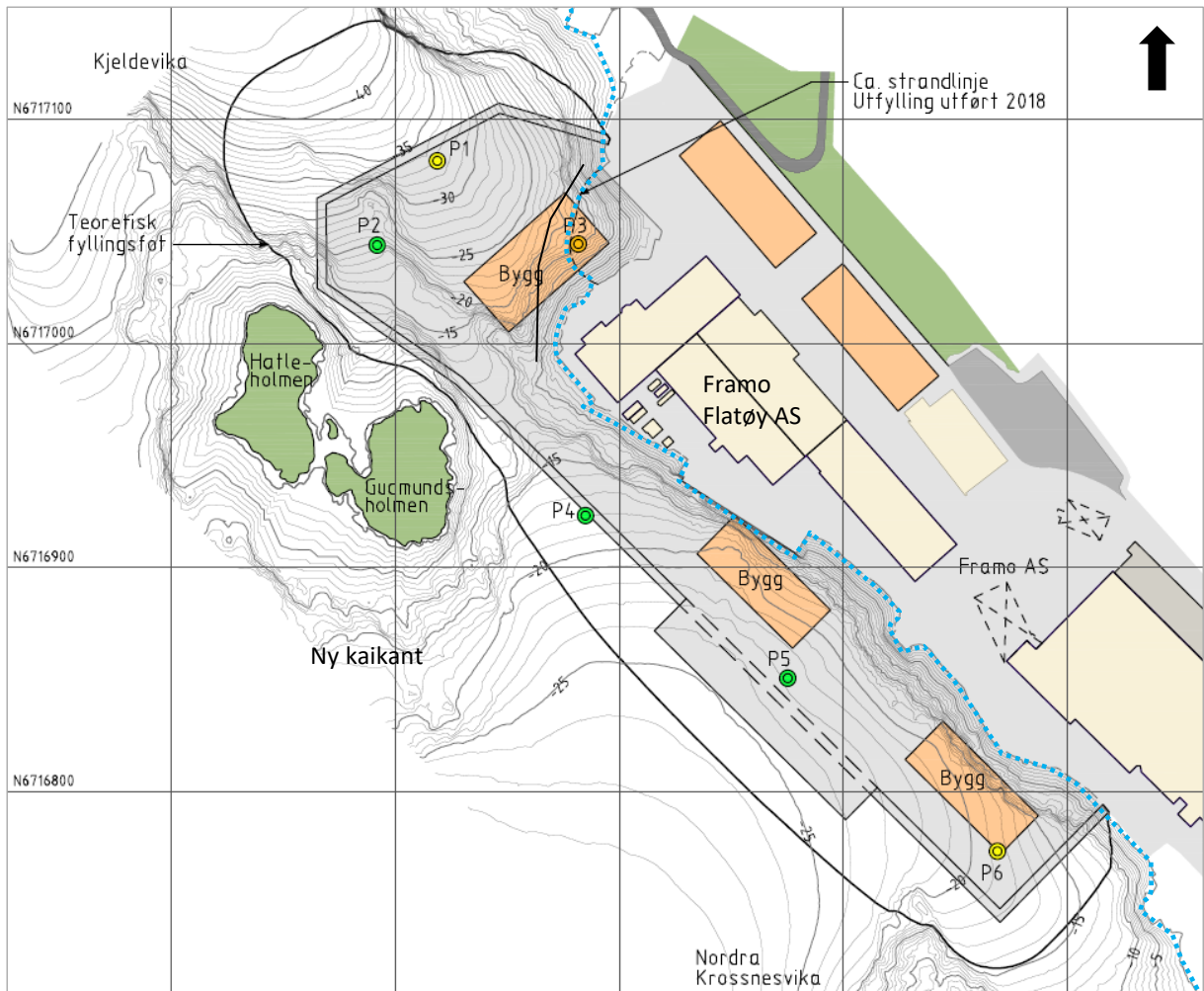
Figur 4-1: Kart som viser omtrentlig avgrensning av planlagt utfyllingsområde (innenfor fyllingsfoten). Blå linje markerer omtrentlig dagens strandlinje. P1–P4 viser omtrentlig plassering av prøvestasjonene som ble tatt i 2013, og P5 og P6 viser omtrentlig plassering av stasjonene som ble tatt i 2019. Fargen på prøvestasjonene viser høyeste påviste tilstandsklasse i henhold til Miljødirektoratets veileder 02:2018 (jf. figur 4-3).