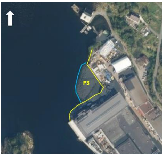
Figur 3-1: Flyfoto som viser omtrentlig strandlinjen i 2015 (gul) og 2018 (blå) i området der prøve P3 ble tatt i 2013.

I 2018 ble det foretatt utfylling fra land i nordlige del av planlagt utfyllingsområde (ref. www.norgebilder.no ). Deler av sjøområdet der stasjon P3 ble tatt er nå (delvis) dekket av utfylte masser (se Figur 3-1).