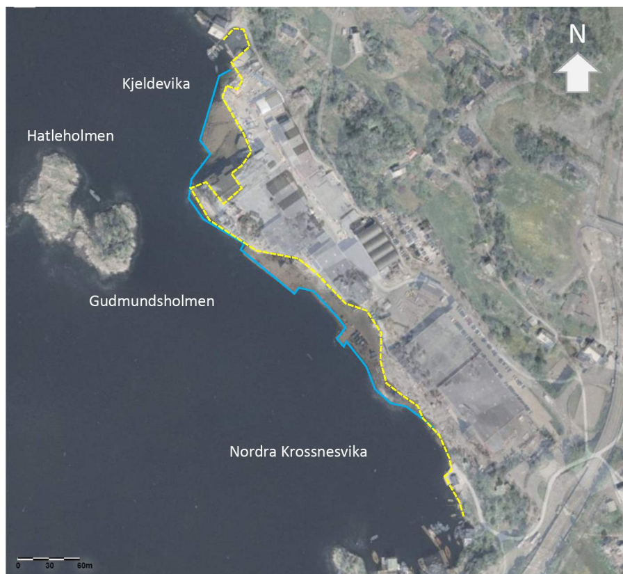
Figur 2-2: Omtrentlig plassering av strandlinjen i 1951 (gul linje) og i 2018 (blå linje).