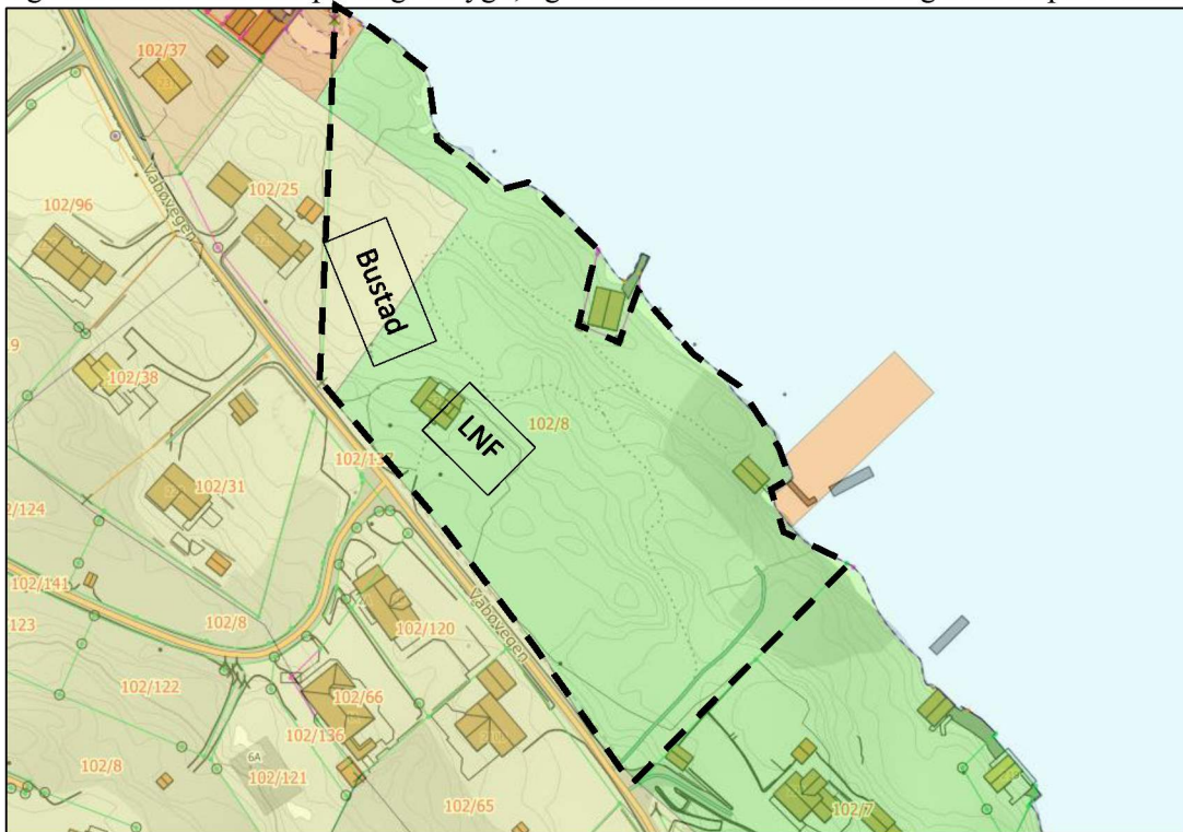
Figur 2: Kartutklipp som syner dagens arealføremål i KPA.

Dagens status i KPA er at den nordvestlege delen av omtalt eigedom er avsatt til bustad, medan Resterande del av eigdommen er avsatt til LNF (Figur 1). Bustaddelen av eigdommen er allereie planlagt utbygd, og det er sendt inn ein frådelingsøknad på arealet.