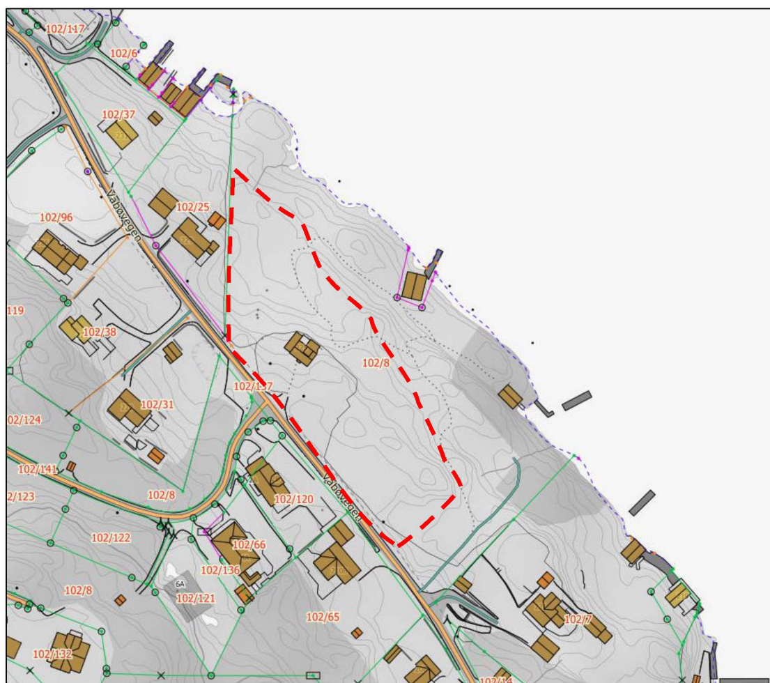
Figur 1: Kartutklipp som viser innspelsområde.

Sender på vegne av tiltakshavar inn innspel til ny kommuneplan i Alver. Innspelet omhandler kort forklart å utvide bustadføremålet på gbnr. 102/8, og vil medføre fortetting av eit attraktivt buområde.