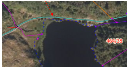
Bilde 6: Veg langs vatnet.