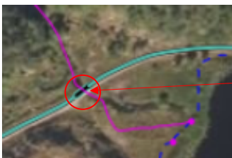
Bilde 5: Bru på tilkomstveg.