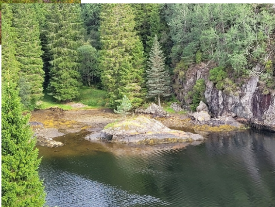
Bilde 8 og 9: Badevika ved lav fjæra sjø. Lite opphaldsareal.