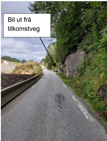
Bilde 1: Tatt frå midt i vegen ved raud x i bilde 2