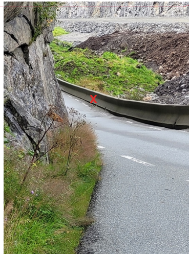
Bilde 2: Viser førar si sikt slik bilen dtår plassert på bilde 1.