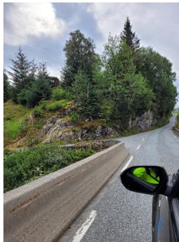
Bilde 3: Avkøyrslø motsatt side enn bilde 1.

Dagens avkøyrslø har særleg dårleg sikt mot venstre. Avkøyrslø må endrast med utforming som tilfredstiller krava til avkøyrslø frå offentleg veg før det gis løyve til utbygging i hyttefeltet.