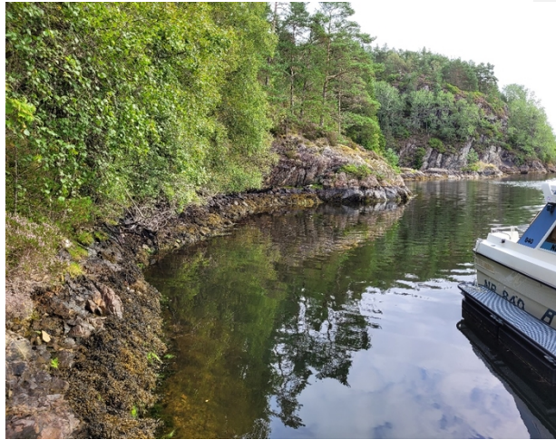
Bilde 7: Bergsida kor det er foreslått gangveg bolta i fjell.

Ut frå størrelsen på badevika vil ein offentlig tilkomst langs begsida tilsei at kommunen