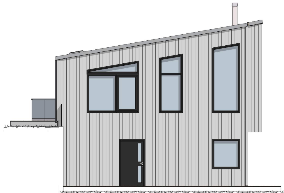
1:100 Fasade 2