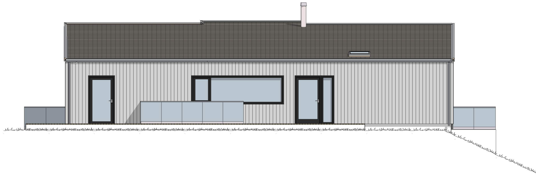
1:100 Fasade 1