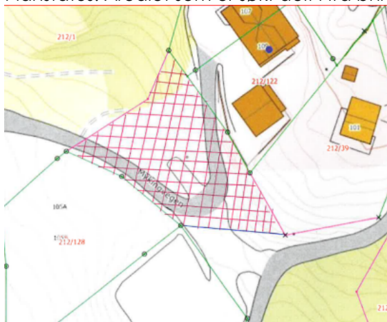
Fig. 1. Skissert utforming av parsellen.

Planstatus: Arealet som er søkt delt i frå bnr. 5 er i gardskartet registrert som bebygd, samf. etc. Utforminga av parsellen er tenkt om lag slik som skissert i fig. 1. til venstre. Delar av arealet tener i dag som tilkomst til bnr. 122 som skal overta arealet. Vidare tener arealet som tilkomst til eigedomane gnr. 212, bnr. 25, 39 og 123.