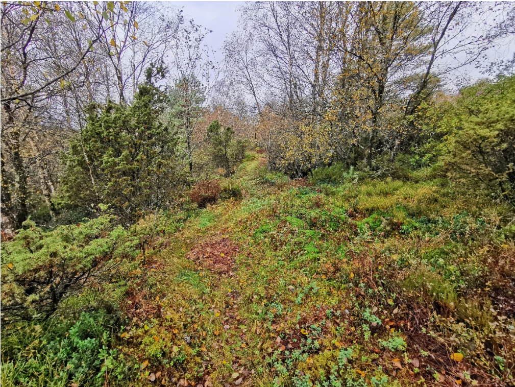
Fig. 2. Venstre del (i biletet) av hestevegen må hevast noko.

Tiltaket er vurdert ut i frå naturmangfaldslova §§ 8-12 jf. § 1 og 7. Kommunen finn at kunnskapsgrunnlaget i § 8 og «føre-van» prinsippet i § 9 i naturmangfaldslova er godt nok til å fatte vedtak.