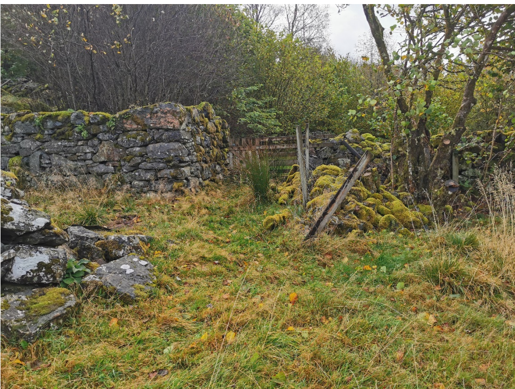
Fig. 3. Tufter etter gardfjøs til venstre og steingarden mot høgre i biletet. Passasjen mellom steingarden og tuftene etter gardfjøs, må utvidast for å kome fram med traktor.