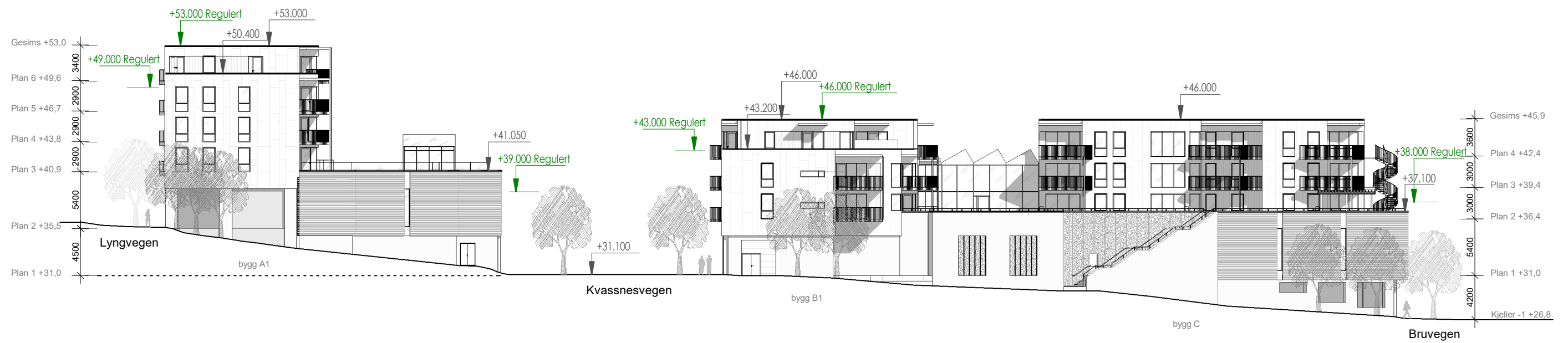
Fasade øst 1:400