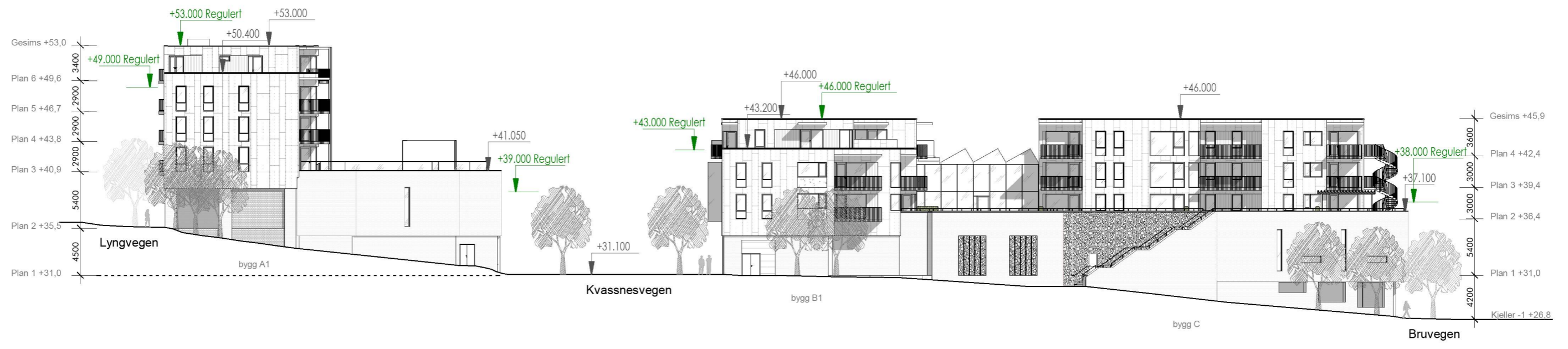
Fasade øst 1:400