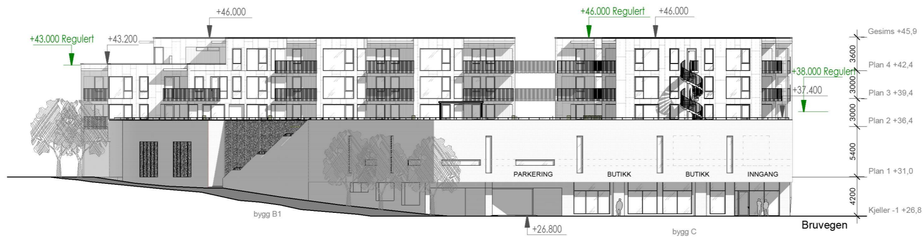
Fasade sør bygg B/C 1:400