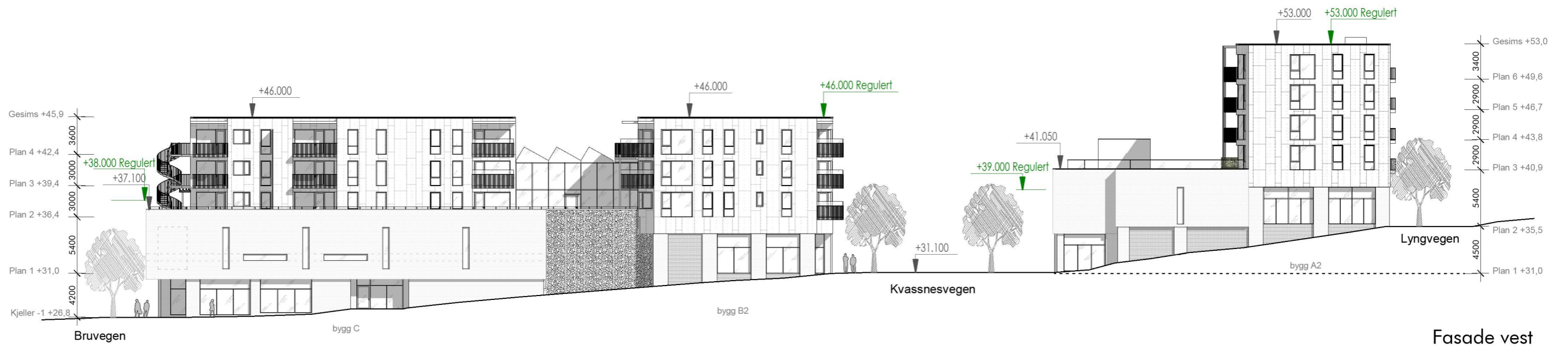
Fasade vest 1:400