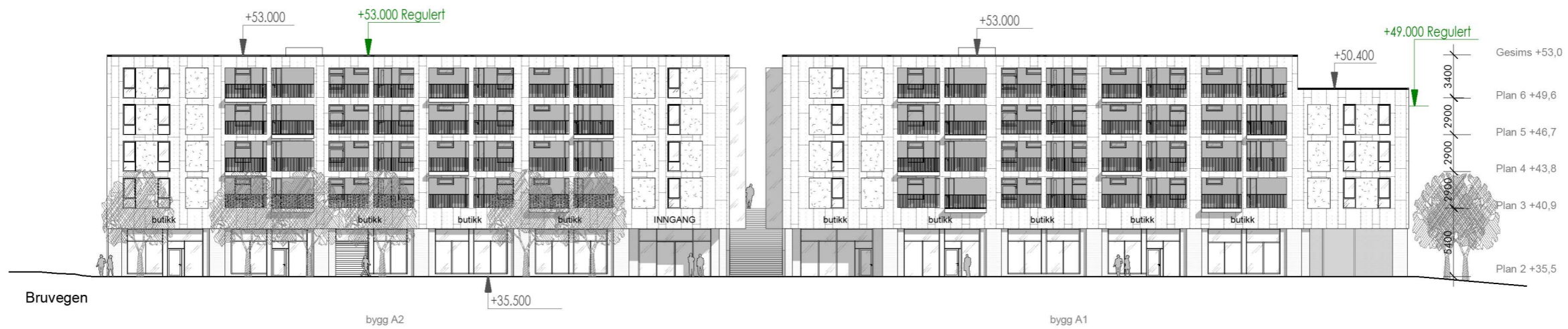
Fasade nord bygg A 1:400