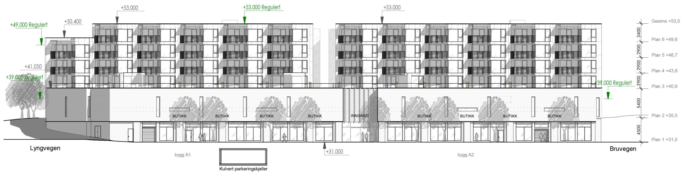
Fasade sør bygg A 1:400