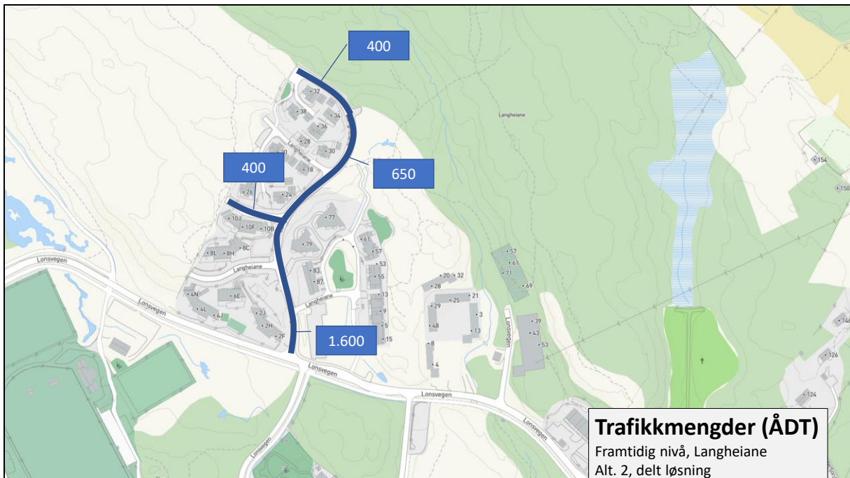
Figur 3. Beregnet, framtidig trafikkmengde med 220+70 nye boliger i Langheiane. Alternativ 2, delt løsning (regneeksempel med jevn fordeling av tilkomst).

Dersom man tenker seg et alternativ basert på en jevn fordeling av tilkomsten til de 220 nye boligene i Langheiane (Lonena aust), ville dette gitt følgende trafikkmengder: