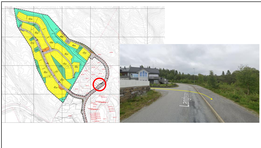
Figur 4. Krysningspunkt for myke trafikanter / viktig gangakse som fører økt eksponering av biltrafikk i Alternativ 2.

Det understrekes at med lavt fartsnivå for biltrafikken, vil et slikt krysningspunkt normalt være oversiktlig og trygt, men økt biltrafikk vil kunne påvirke trygghetsfølelsen og fremkommeligheten/mobiliteten for myke trafikanter.