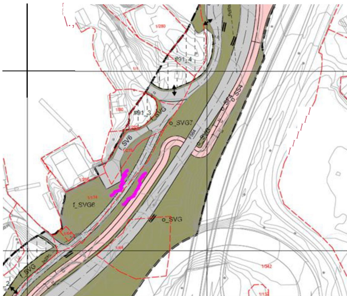
Utsnitt fra framlegg til planending

Moglegheit for gjennomføring og eventuelle konsekvensar knytt til etablering av regulert l0ysning b0r derfor avklarast med Statens vegvesen og Vestland fylkeskommune for sluttbehandling i kommunen.