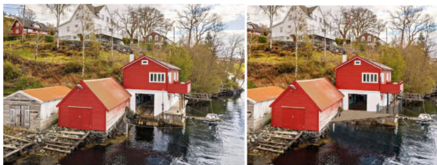
Illustrasjon av vestfasaden av eksisterende og ny situasjon.

I denne saken er det snakk om å oppføre en kai foran eksisterende naust, over dagens slipp, for å utbedre mulighetene for lagring av båter. I dag fortøyes eierens båt langs sørfasaden som vist på bilde under. Fortøyning av båt er komplisert i det smale sundet pga passerende fritidsbåter og Norleds sine passasjerbåter. Blir tiltaket godkjent vil en kunne fjerne dagens fortøyningsanretning.