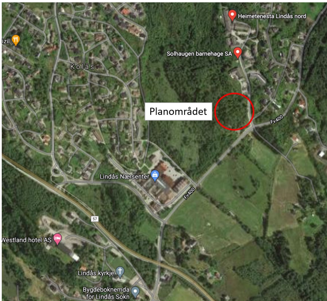
Figur 1: Lokalisering av planområdet vist med raud sirkel.