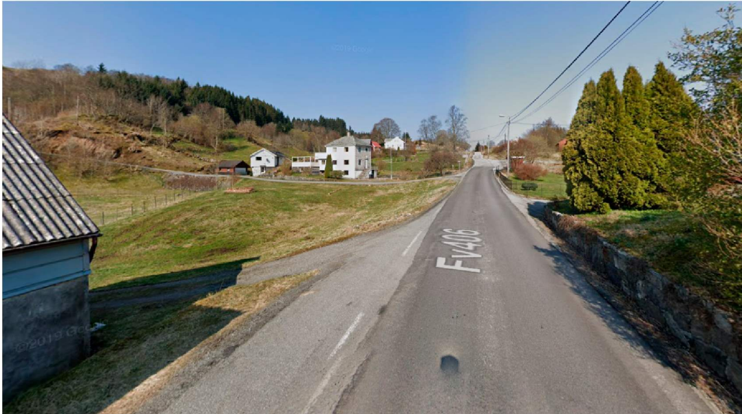
Utsnitt frå google streetview, på fylkesveg 5478 som viser retning nord mot avkjørsel det er søkt om.

Vi vil oppfordre til å se på muligheten for å sanere avkjørsel i sør på planutsnittet med den i nord, som det blir søkt om flytting og utbedring for. Vi ser avkjørselen i sør går til en driftsbygning, som har noe bratt helling fra fylkesvegen som gjør at vi er noe usikker på om det er god nok sikt her. Denne avkjørselen er bare tegnet inn som en pil i reguleringsplanen for veien.