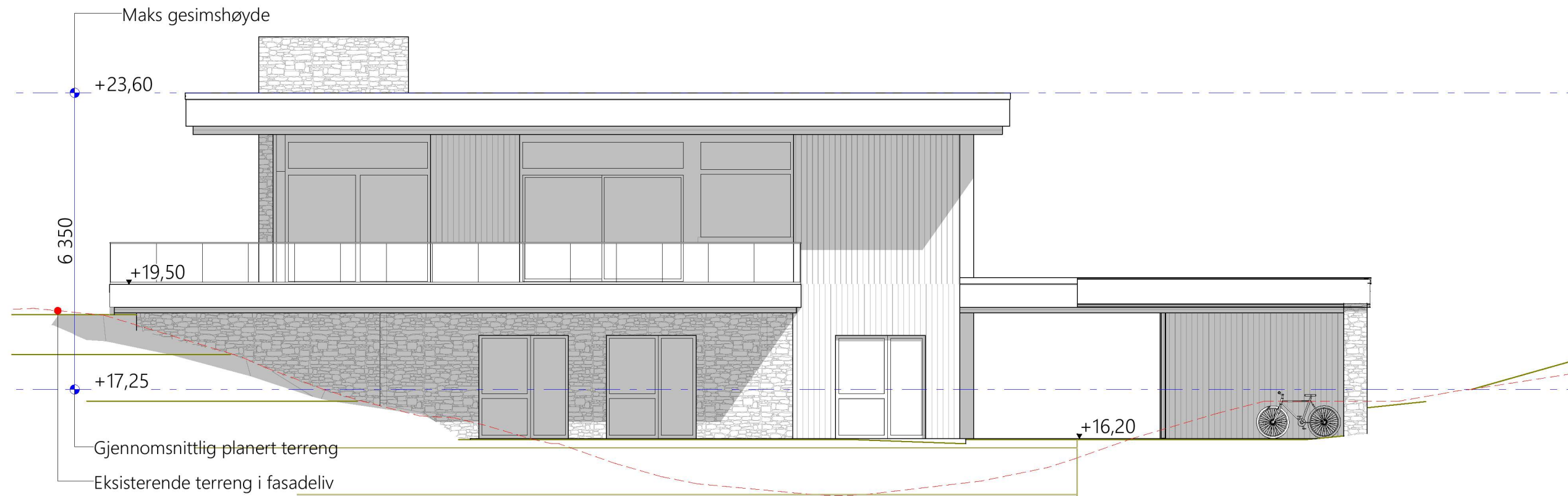
1:100 Fasade Sør-Øst