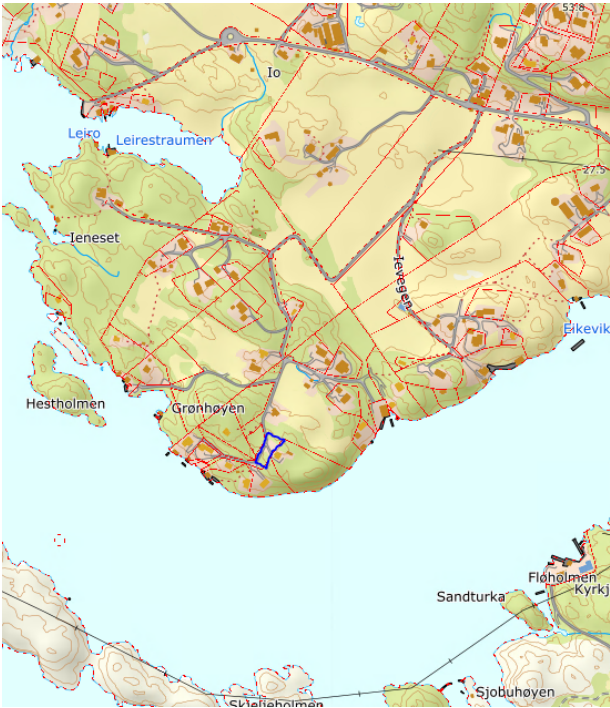
Oversiktskart. Blå strek syner omsøkt areal.