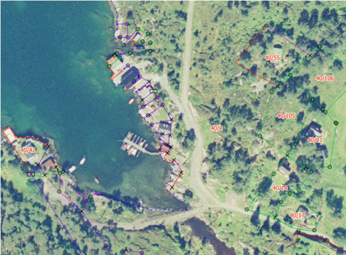
Flyfoto frå 2003 der ein ser den etablerte vegen bak nausta.

Kommunen ser at det ikkje er eit stort inngrep i terrenget sidan det allereie er ein veg der frå før som går parallelt på nesten heile vegen. I tillegg er vegen bak nausta og vil difor ikkje vere ruvande i terrenget frå sjøen. Området er allereie privatisert i den grad det er vegar og naust der forlenginga av vegen går. Som ein ser på flyfoto frå 2003 følg vegen hyttevegen heilt til den tar ein liten avstikkar ned til nausta, og oppleves difor som eit mindre alvorleg tilhøve etter ei samla konkret vurdering.