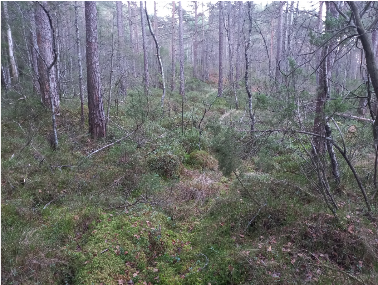
Fig. 6. Delar av skogen er ikkje hogstmoden enno.