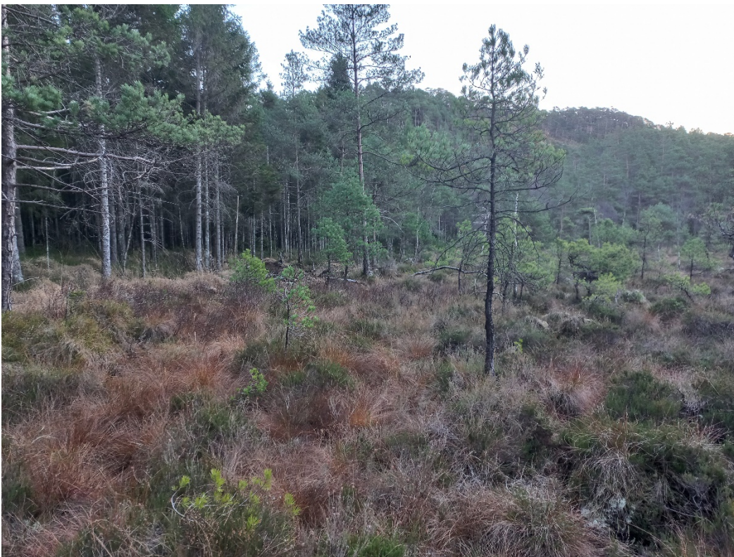
Fig. 5. I nordleg ende går veglina delvis over ei myr. Vi rår til at vegen vert lagt så langt opp mot venstre i biletet, slik at ein unngår minst mogeleg brot i myra. Skogkanten til venstre markerer grensa mellom gnr. 205, bnr. 1 og gnr. 207, bnr. 7.