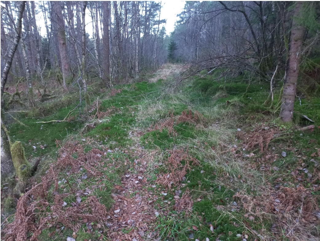
Fig. 4. Ein del av vegen vert lagt på gamal veg som skal klassiserast opp.