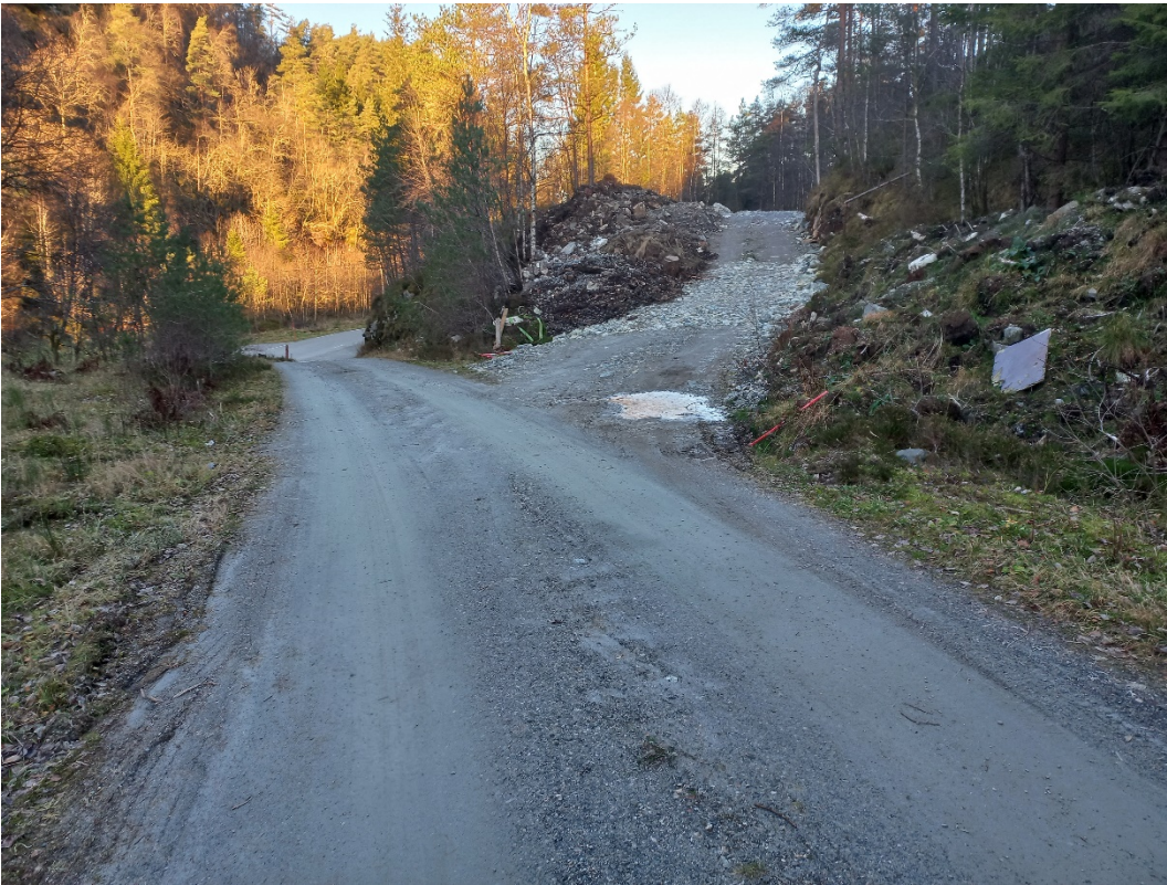
Fig. 2. Vi ser fv. 5452 i bakgrunnen til venstre. Vidare ser vi nyanlegget der det tek av på eksisterande veg og går innover mot grensa til gnr. 205, bnr. 1....