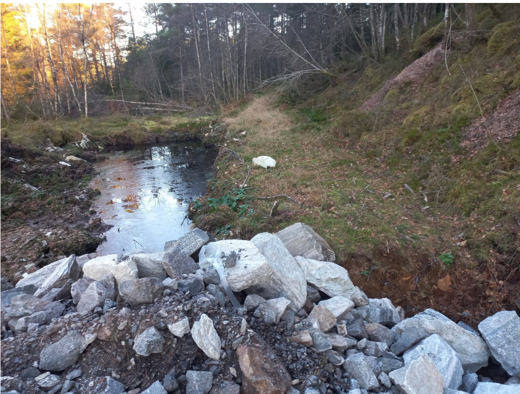
Fig. 3. ... der anlegget om lag stoggar per no.