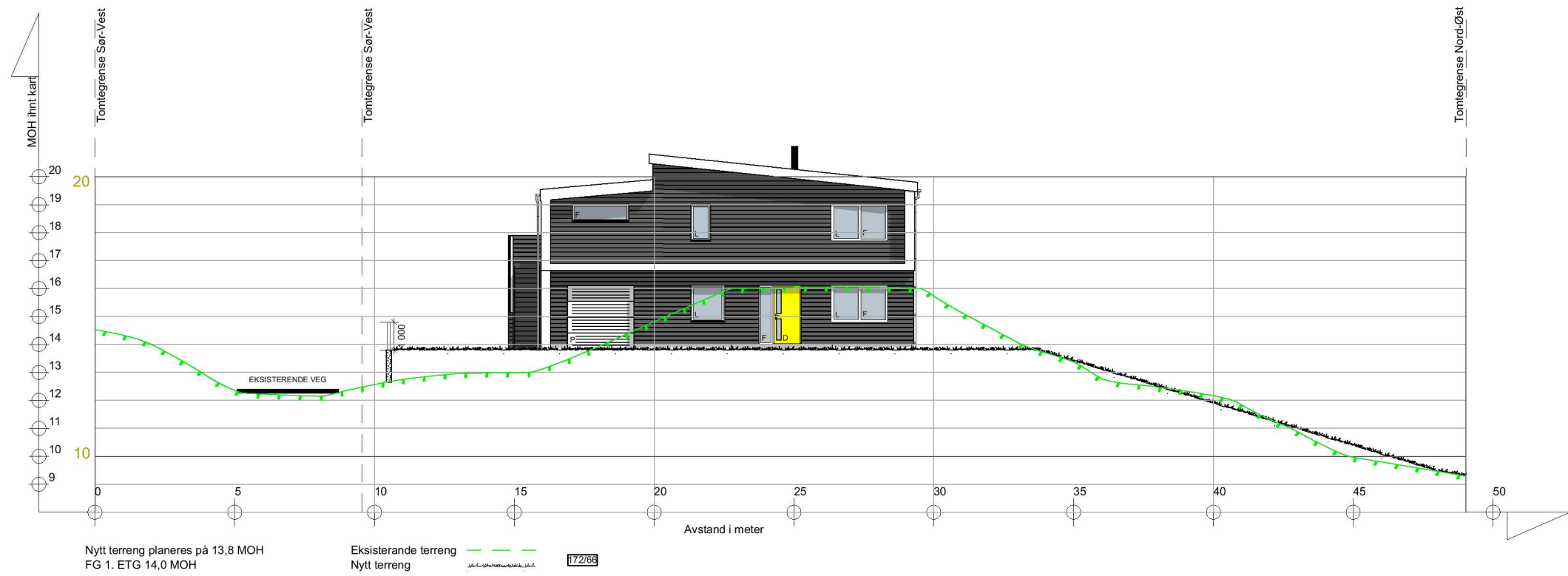
Fasade 1 SØ