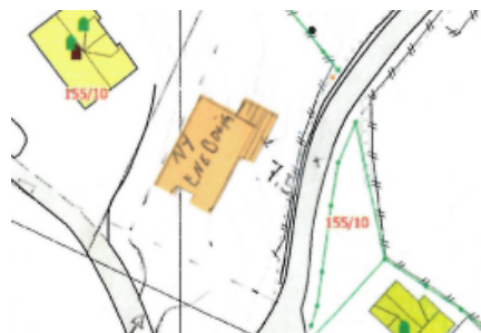
Tidlegare situasjon – dispensasjon gitt med minste avstand 7,5 meter frå vegmidt.