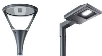
Armatur Glamox: O41 LED 4500 HF 830 WB BL (venstre) O55-250 LED 3000 HF 830 WBA BLACK (høyre)