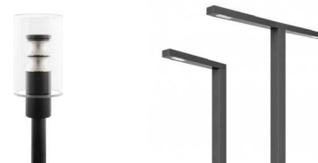
Armatur Selux (forslag fra LARK): Aira Cylinder pole top (venstre) Selux Arca Linear (høyre)