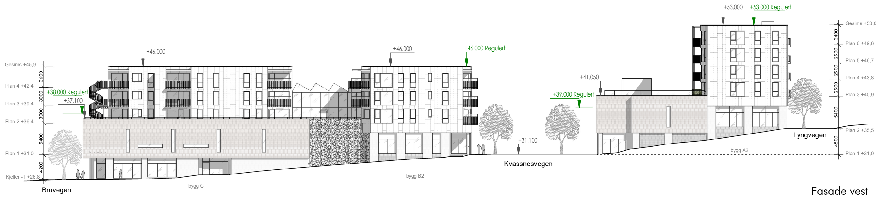
Fasade vest 1:400