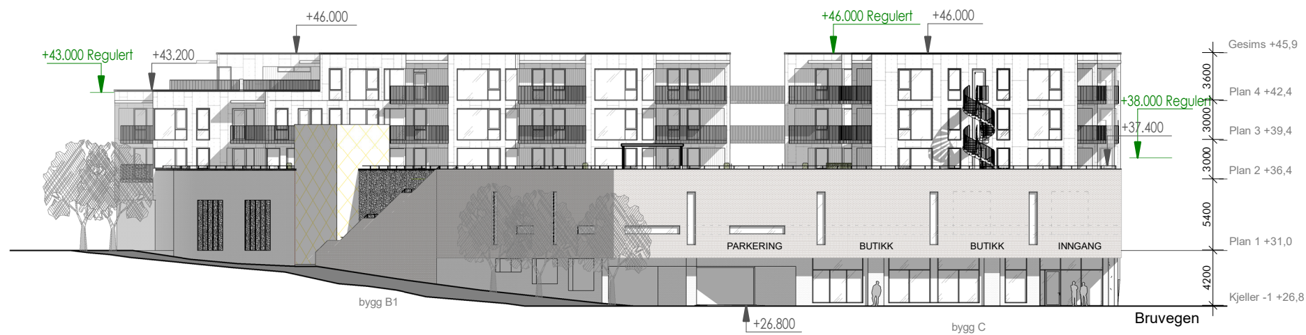
Fasade sør bygg B/C 1:400