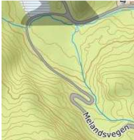
Utsnitt fra nordhordlandskart. Det grå/skyggelagte området i nord viser den delen av fv5312 som omfattes av den over nevnte detaljreguleringsplanen.

Området er i hovedsak uregulert, men den nordligste delen omfattes av detaljregulering KV1133 Myrvollane til Hestdal (planid. 125620180003), som trådte i kraft 12.12.2018. Reguleringsplanen gjelder foran kommuneplanen.