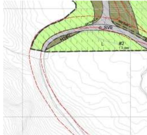
Utsnitt fra arealplankart. Grå farge viser arealformål kjøreveg, brun viser annen veggrunn – grøntareal og grønn viser LNFR-areal.

Det nordligste tiltaket (tiltak 7) er lokalisert på nord- nordøstsiden av svingen og befinner seg derfor på areal avsatt til landbruk-, natur- og friluftformål (LNFR) .