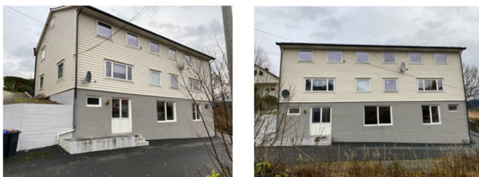
Bilder av eksisterende bygg (hovedfasade - sett fra sør-vest)

Lokalene i byggets 1.etasje søkes omgjort til boligformål med 2 nye leiligheter, og det er ønskelig å etablere balkonger på den sør-vestre fasaden for eksisterende boliger i 2. -og 3.etasje. Totalt er det altså snakk om å legge til rette for 6 boenheter i eksisterende bygg. De nye boligene i 1.etasje får terrasseareal under de nye balkongene. Dette gjøres for å imøtekomme krav til privat uteoppholdsareal for boligene, samt at man ved en viss ombygging av eksisterende bygg ønsker å øke boligkvaliteten med mer åpne løsninger og bedre utnytting av sjøutsikt.