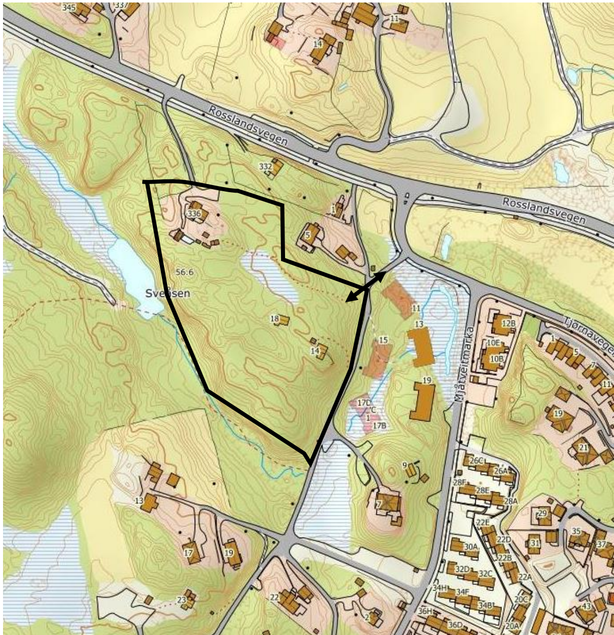
Figur 1 Kart som viser området og tilkomstveier.

Området ligger sør på Holsnøy ved Mjåtveit i Alver kommune. Området har tilkomst fra Rosslandsvegen via Mjåtveitmarka, se figur 1 og 2.