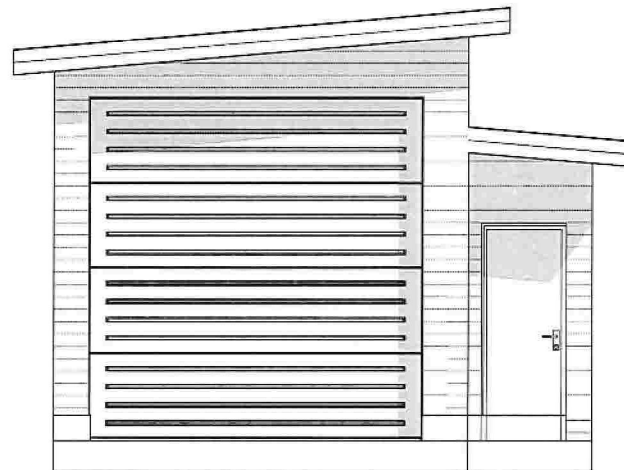
1:50 Fasade Sør