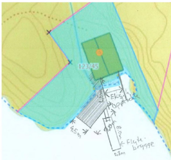
Kart med tiltak.

Kai blir omsøkt med om lag 31 m 2 og flytebrygge med om lag 18 m 2 med tillegg av langgang, som vist på kartet under: