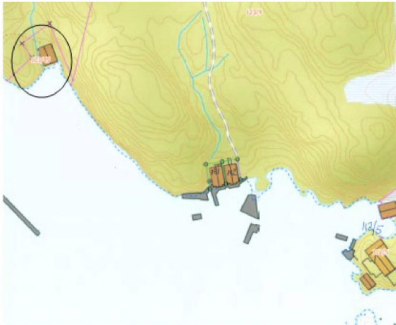
Tiltakshaver sin eigedom markert oppe til venstre. Tilsvarende tiltak utført i området som vist.

På Risøy, gbnr. 81/47, er det bygd naust og kai for ca. 20 år sidan. Også dette på gitt løyve og dispensasjon, og eigedomen ligg tvers over sundet for omsøkt eigedom. I det tilfellet er det sprengt inn i fjellet, bygd bilveg, stor kai og parkeringsplass. Det er 200 meter mellom dette naustet og tiltakshaver sitt naust. Eigedomen er vist på kartet under: