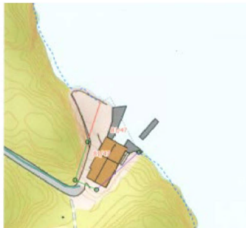
Tiltak utført på gbnr. 81/47

På Risøy, gbnr. 81/47, er det bygd naust og kai for ca. 20 år sidan. Også dette på gitt løyve og dispensasjon, og eigedomen ligg tvers over sundet for omsøkt eigedom. I det tilfellet er det sprengt inn i fjellet, bygd bilveg, stor kai og parkeringsplass. Det er 200 meter mellom dette naustet og tiltakshaver sitt naust. Eigedomen er vist på kartet under: