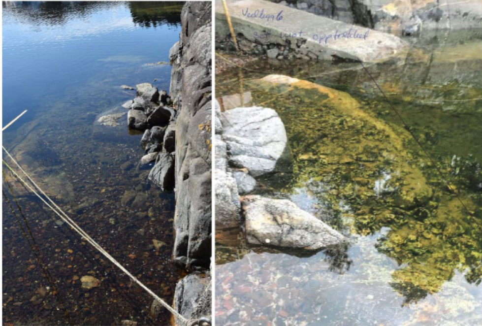
Bileta viser kor grunt her er. Det er dermed vanskelig å legge til med båt til eigedomen på ein trygg måte.

fjóra sjø. Då må søkjar gå på skråplanet/opptrekket som er sleipt av groe. Ved maksimal fjøre flyt ikkje båten inntil opptrekket, så då må han ned i fjóra for å gå om bord. Bileta under viser kor grunt her ved fjóra sjø.