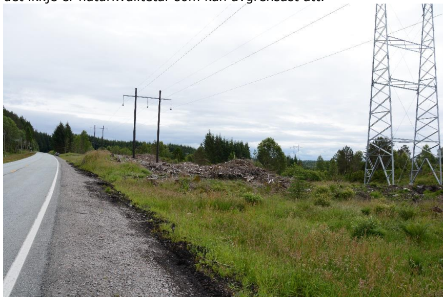
Figur 5: Mellom Kårdal og Hope går vegen langs en kystlyngheilokalitet. Langs vegkantane er området preget av gjengroing og er vegetasjonen så forstyrra at det ikkje er naturkvalitetar som kan avgrensast att.

gjengroing og mellom kraftlina og vegen er vegetasjon og delvis også jorddekket så forstyrra at det ikkje er naturkvalitetar som kan avgrensast att.