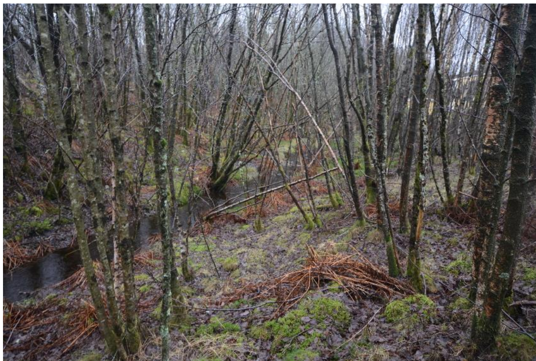
Figur 8. Miljø frå gråorskogen.