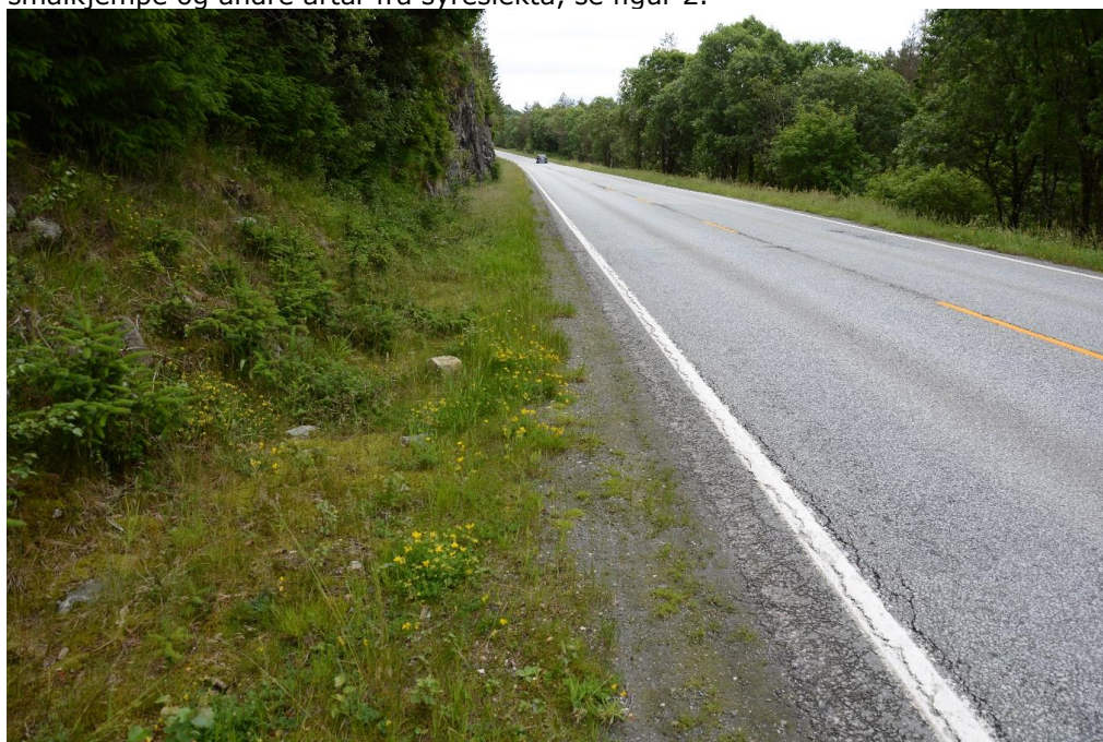
Figur 2: Vegetasjonen langs vegkantane er artfattige og består av lite krevjande artar. Langs heile traséen er det spreining av edelgran.

Planområdet blei synfart 7. og 8.juli 2015. Utvidelser av planområdet førte til at det ble gjort supplerende feltundersøkelser 20. februar 2017. Undersøkningsområdet ligg i eit småkupert og variert kulturlandskap med spreidd busetnad, beitemark, fulldyrka mark, ung skog, områder med kystlynghei og myrområder. Tiltaksområdet tilhøyrrer Lindås og Austrheim kommune. Berggrunnen i området består av amfibolittrik gneis og amfibolitt. Amfibolittrike rike bergarter kan gi grunnlag for ein middels riker vegetasjon. Vegetasjonen langs vegkantane er likevel dominert av vanlege, lite krevjande artar som engsoleie, hundekjeks, geiterams, vendelrot, legeveronika, revebjelle, kvitmaure, tepperot, bringebær, raudkløver, kvitkløver, groblad, smalkjempe og andre artar frå syreslekta, se figur 2.