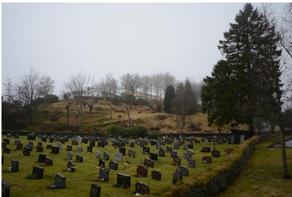
Figur 6. Ovanfor kyrkjegarden på Lindås ligg eit område som kan ha naturverdiar som bør beskyttast frå inngrep.

Like vest for kyrkja i Lindås sentrum ligg eit hagemarkliknande område med fleire styva tre. Ein er noko usikker på korleis området blir skjøtta. Området vart vitja i februar 2017, og det var vanskeleg å avgjera om det blir slått eller beita. Om det blir planlagt å gjere inngrep i dette området vil det vere viktig å gjennomføra ei meir grundig inventering i vekstsesongen.