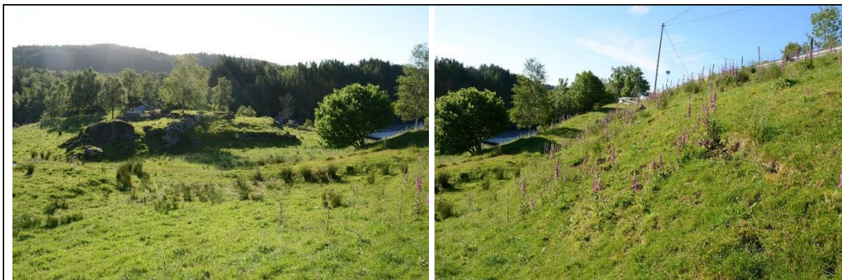
Figur 3: Beitemarker preget av gjødsling.

Skogsmiljøet er for det meste ung skog med bjørk og furu. Langs vegen er det ellers spredt førekomst av hassel, ung eik, osp, rogn, or og andre vanlege treslag. Langs heile traséen er det spreining av edelgran.