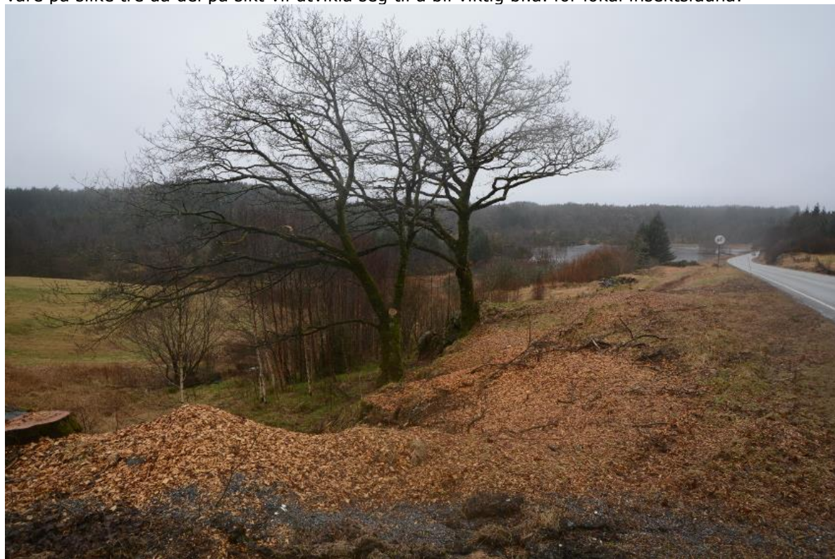
Figur 4. Bildet viser to eiketre ved krysset Mongstadvegen-Hopsvågen

Ved krysset Mongstadvegen-Hopsvågen står to eiketre med noko storleik (32 V 284359 6745506). Desse er ikkje innhol, og er under målet for utvald naturtype. Det er likevel viktig å ta vare på slike tre då dei på sikt vil utvikla seg til å bli viktig bl.a. for lokal insektsfauna.