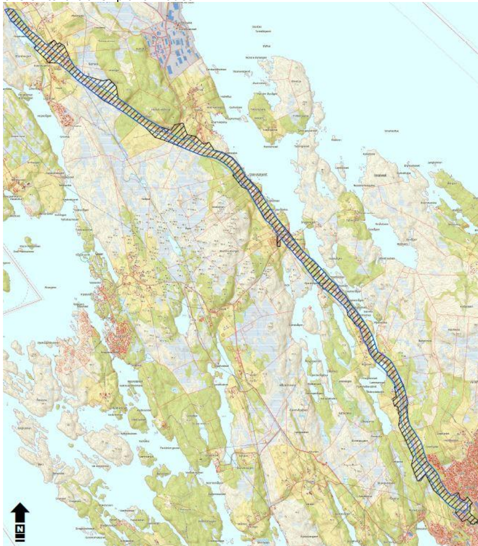
Figur 1. Planområdet slik det kjem fram av planane til Statens vegvesen

Området ligg langs Lindåsvegen (FV57) mellom Lindås tettstad og Mongstad. Planen går ut på å leggje gang- og sykkelveg på austsida av fylkesvegen langs heile strekninga. Figur 1 viser eit oversiktskart over planområdet.