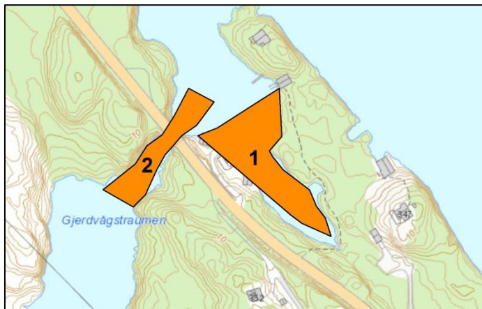
Figur 9: Verdikart med registrerte naturtyper i planområdet