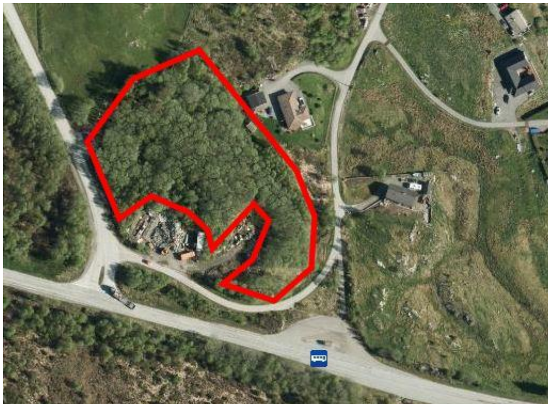
Figur 7. Avgrensing av ein gråorskog med bekkedal ved Knarvik.

Ved Knarvikgarden ligg ein relativt ung frodig fuktskog med bekkeløp. Tidlegare ville denne kunne vore avgrensa som gråor-heggeskog, men etter nye kartleggingsreglar (Hb13 rev. 2014) er det ikkje lenger grunnlag for å avgrensa denne som eigen naturtypelokalitet. Vi ønsker likevel å visa til denne type biotopar er viktige områder for spurvefugl spesielt. Men også som gode skjulområde for hjortevilt og andre pattedyr i eit relativt ope kulturlandskap. Slike fuktige skogar kan og gje grunnlag for fuktkevjande lavartar på sikt, om skogen får stå og aldrast.