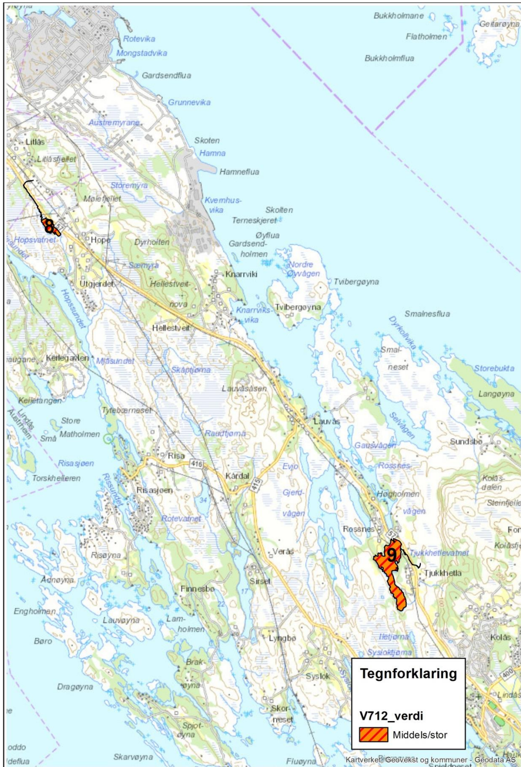
Figur 12: Verdikart for viktige leveområder for artar i planområdet.

Figur 7 viser verdikart for leveområder for artar i planområdet. Verdien er sett med utgangspunkt i at ål fortsatt nyttar vatnet som leveområde.