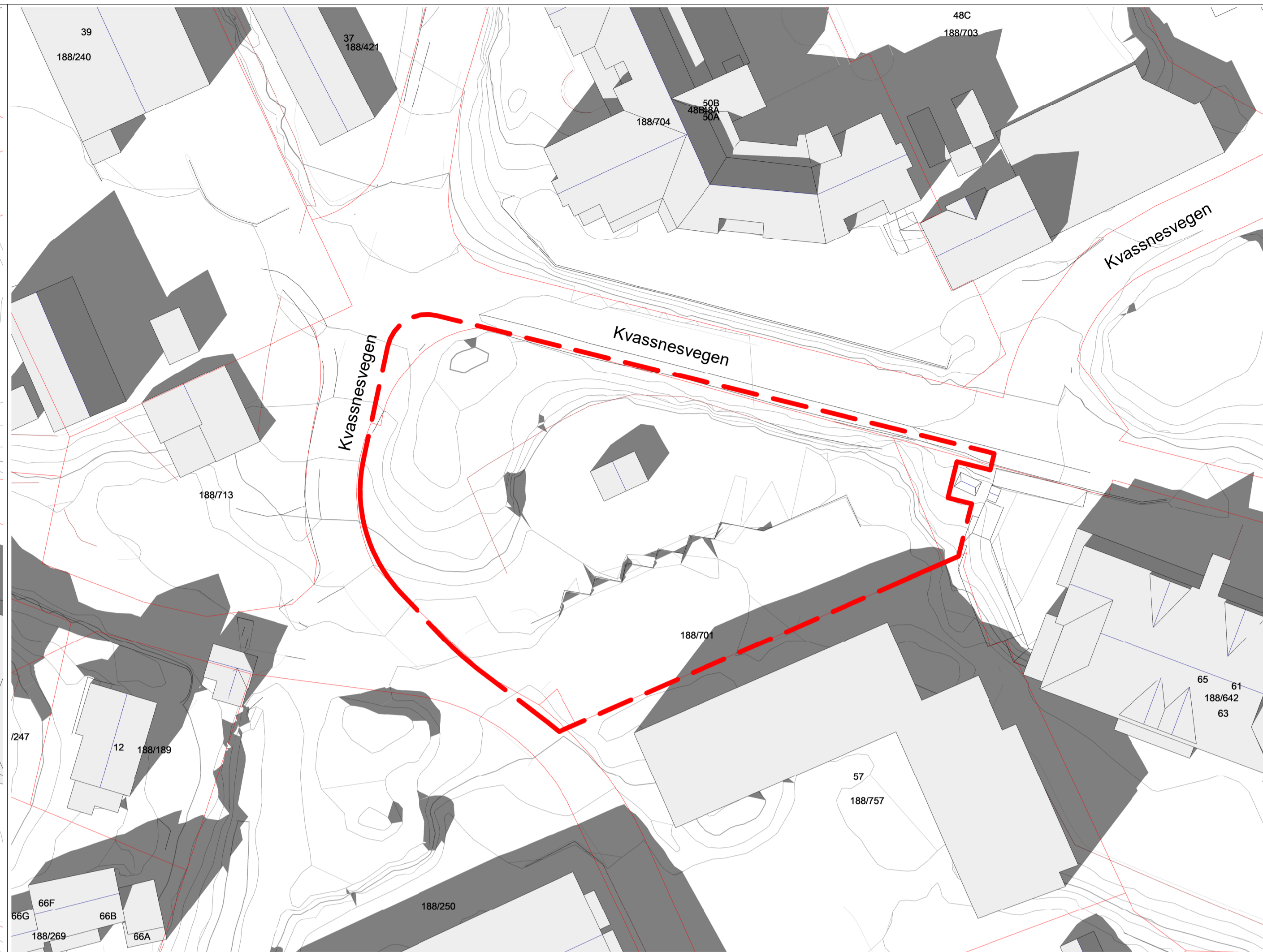
kl. 15.00 - vårjevndøgn