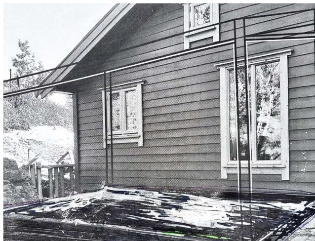
Fasaden mot Nord

Etableringen av campingplassen utløste ganske store protester fra hytteeierne i området. Vi som hadde hytter på Lammneset valgte å ikke involvere oss i denne «konflikten» av hensynet til grunneier. I årene som har gått etter etableringen har vi gode erfaringer med måten området har blitt forvaltet. Arbeidet med campingplassen har vært omfattende med endringer for et stort areal, og vi ser ikke for oss at dette tiltaket skulle påvirke området i noen negativ forstand.