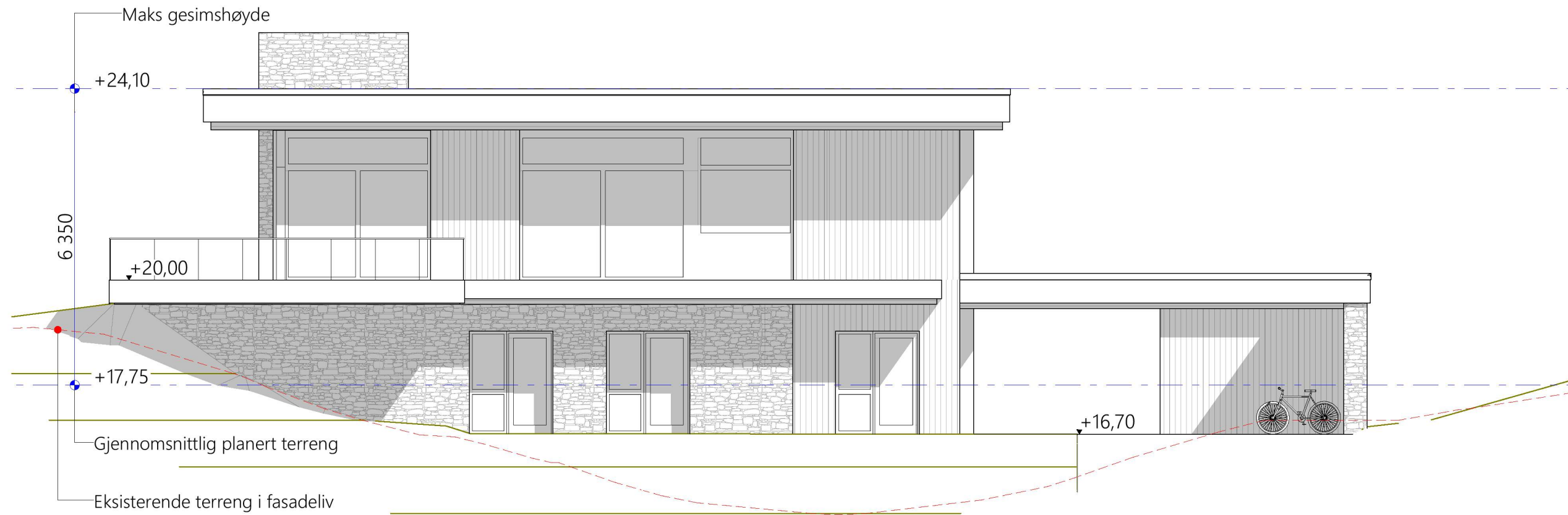
1:100 Fasade Sør-Øst